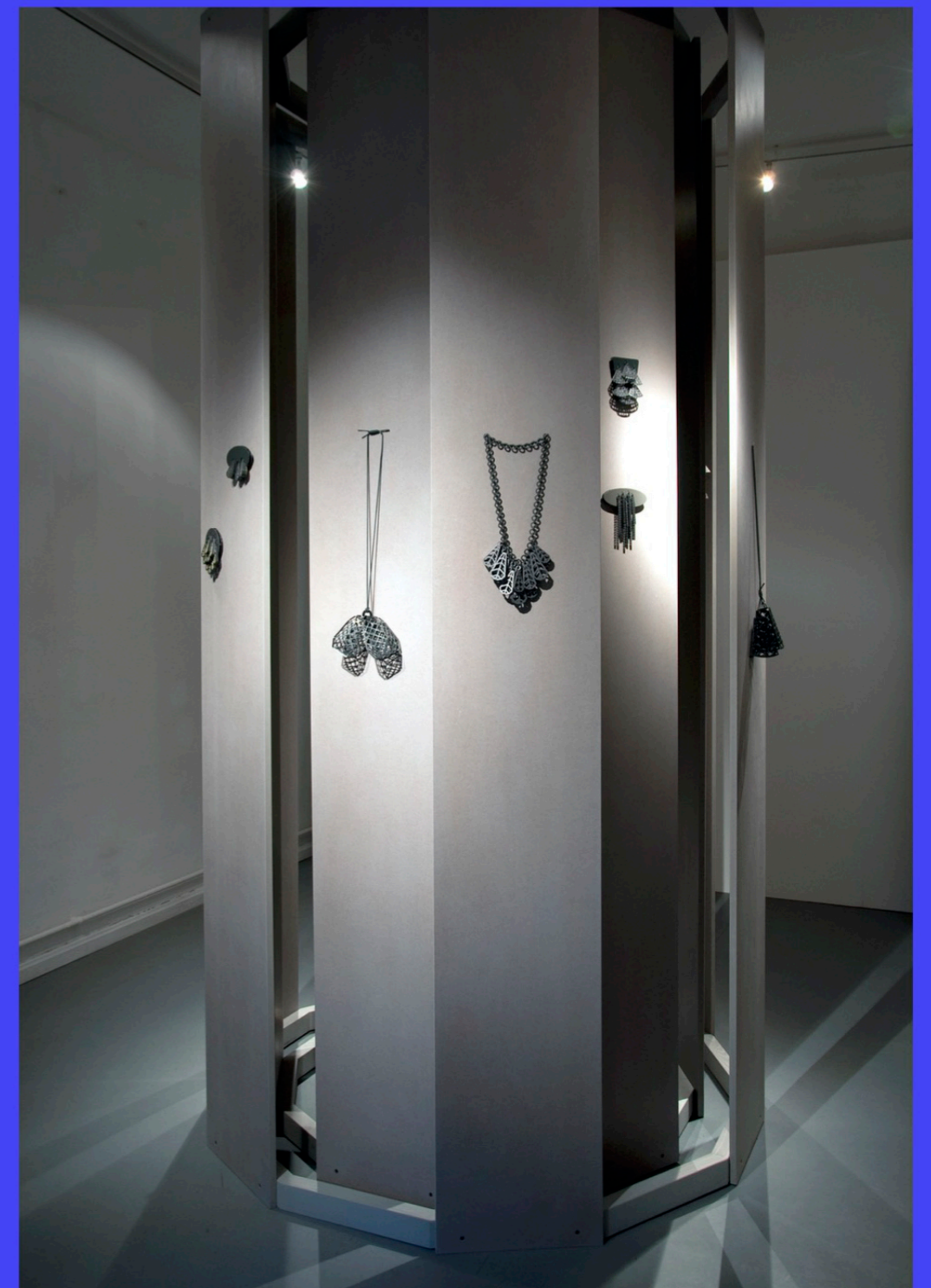
„2013 – Melanie, Du möchtest wirklich einen Turm in die Galerie stellen?!“ Olga 2013 München, Galerie Biró: roundabout